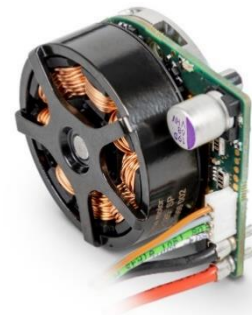
El nuevo motor brushless ECX FLAT 32 con electrónica integrada.