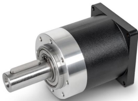
El nuevo GPX70: un reductor planetario configurable y de gran tamaño.